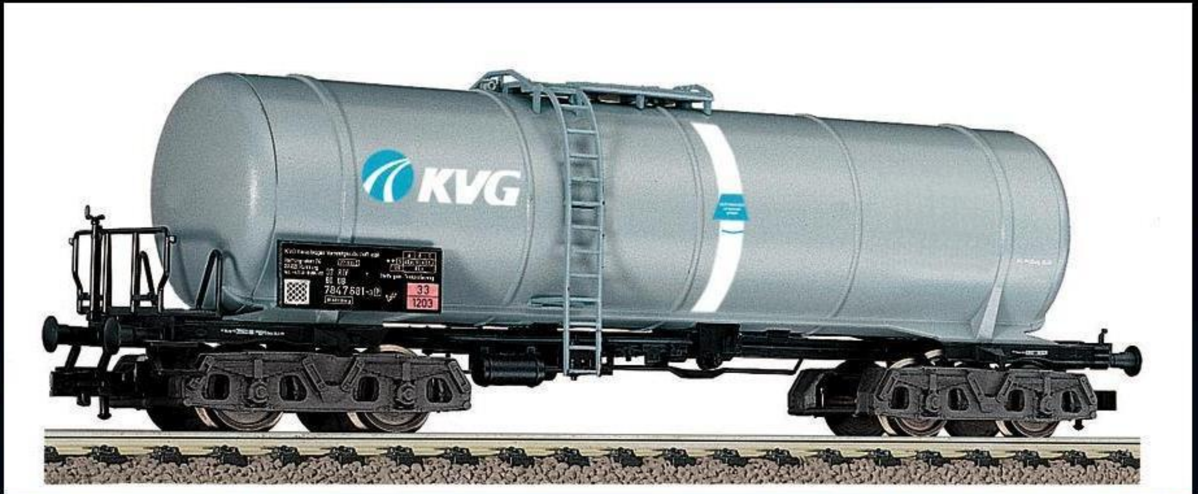
5472 · Kesselwagen KVG , Modell eines 77 cbm Flüssigkeits-Transportwagens, LüP: 165 mm.