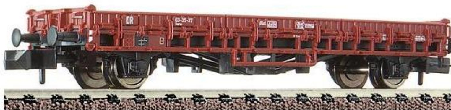
8727 · Güterwagen, Bauart Rmrso der DR, LüP: 75 mm.