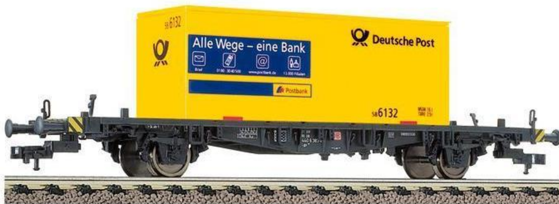
5237 · Container-Tragwagen, Bauart Lgjs 598 der DB AG, LüP: 167 mm.