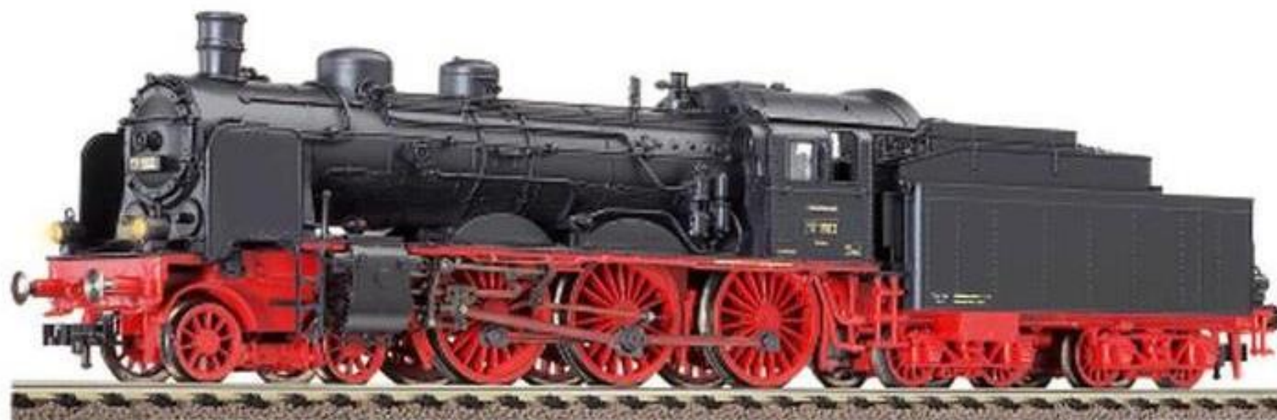
4117 · Schlepptenderlok der DRG, Baureihe 17.10 (preuß. S 10.1) mit Tender 2'2' T 31,5, LüP: 241 mm.