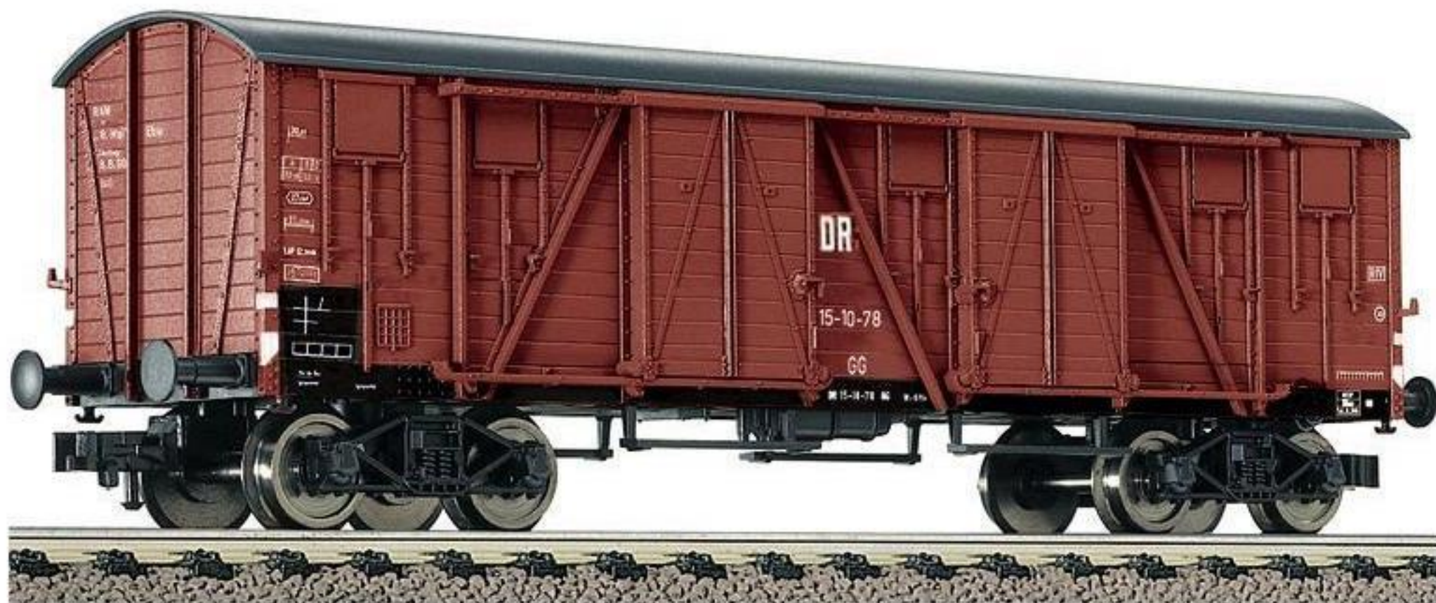
5733 · Gedeckter Güterwagen (US-Bauart) der DR, LüP: 142 mm.