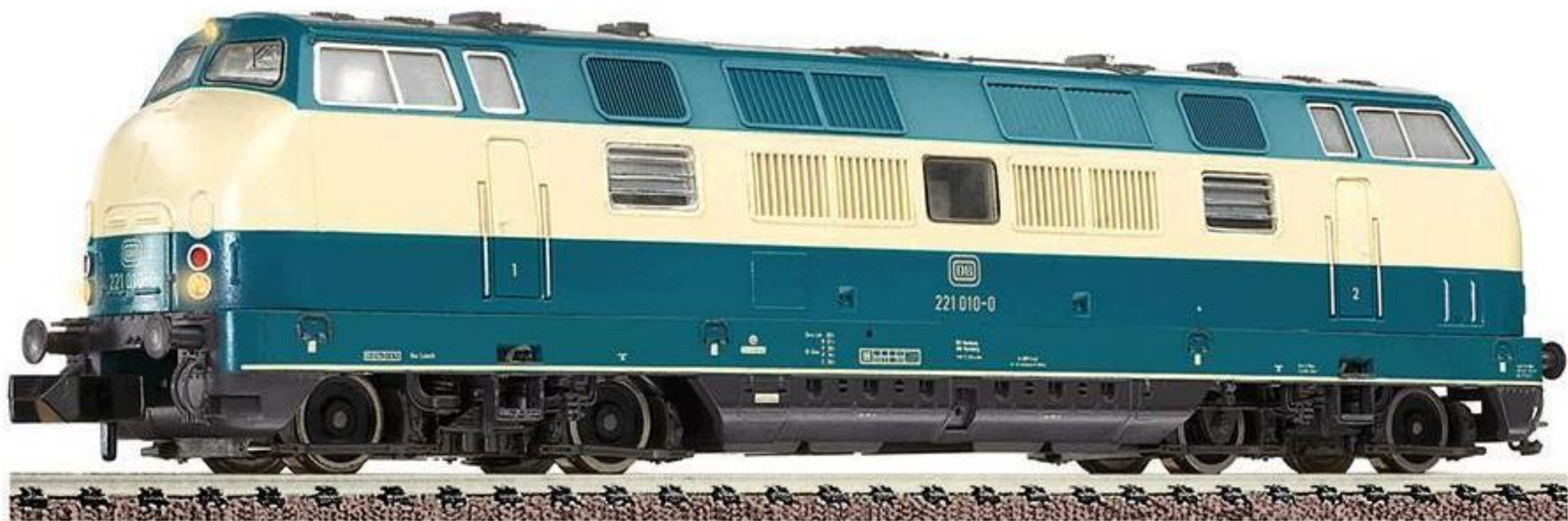
7251 · Diesellok der DB, Baureihe 221, LüP: 115 mm.