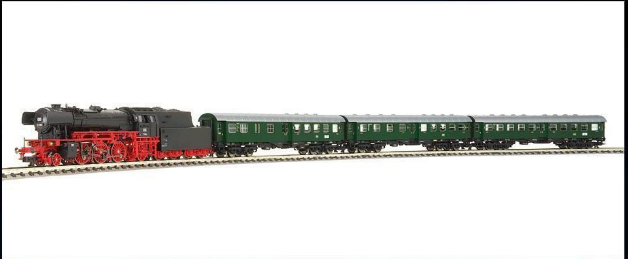
7903 · Geschenckpackung Personenzug der 1950er-Jahre der DB.