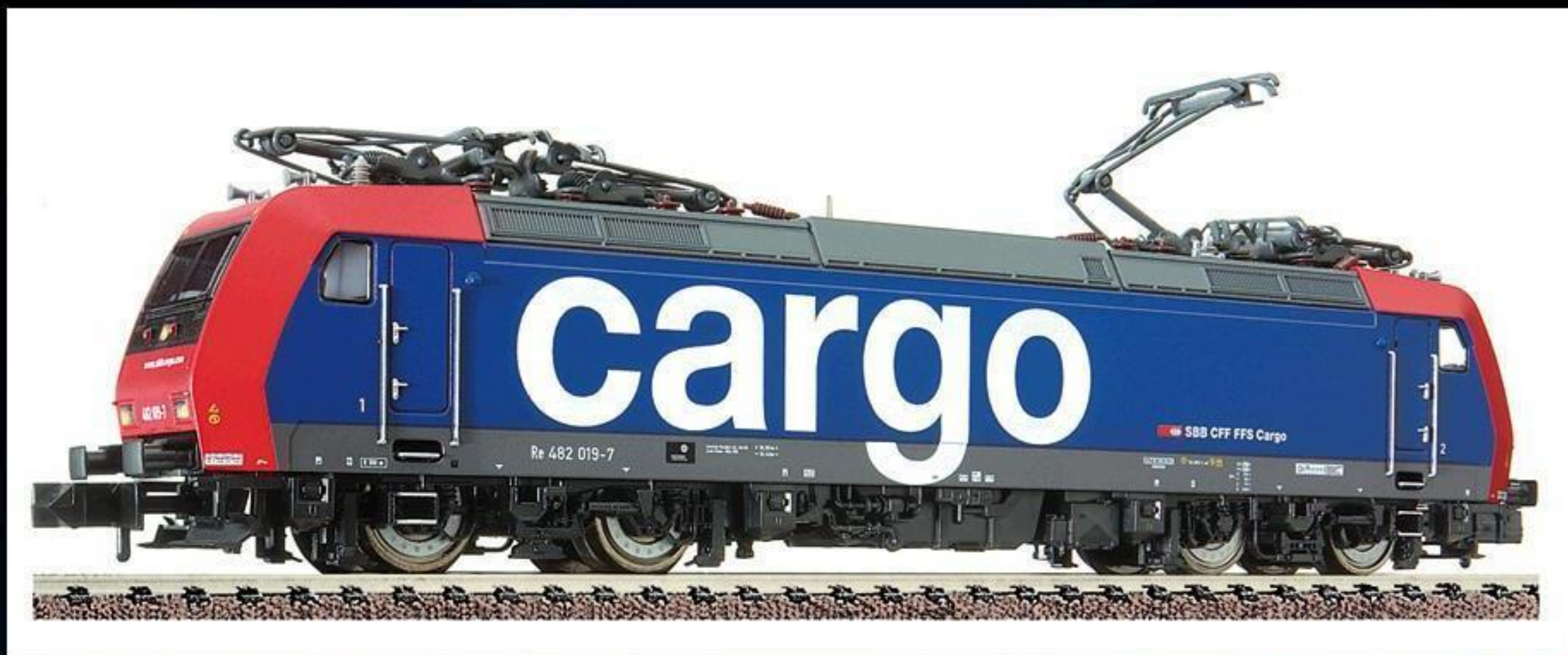
7386 · Elektrische Mehrzwecklokomotive der SBB (SBB-Cargo), Baureihe Re 482, LüP: 118 mm.