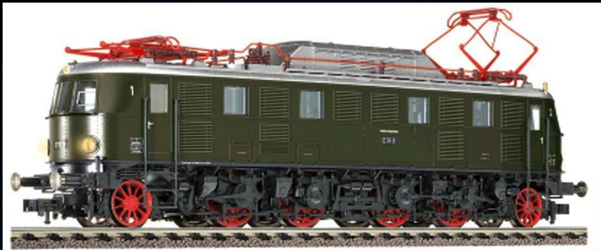
4318 · Elektrische Lokomotive der DB, Baureihe E 19.1, LüP: 195 mm.