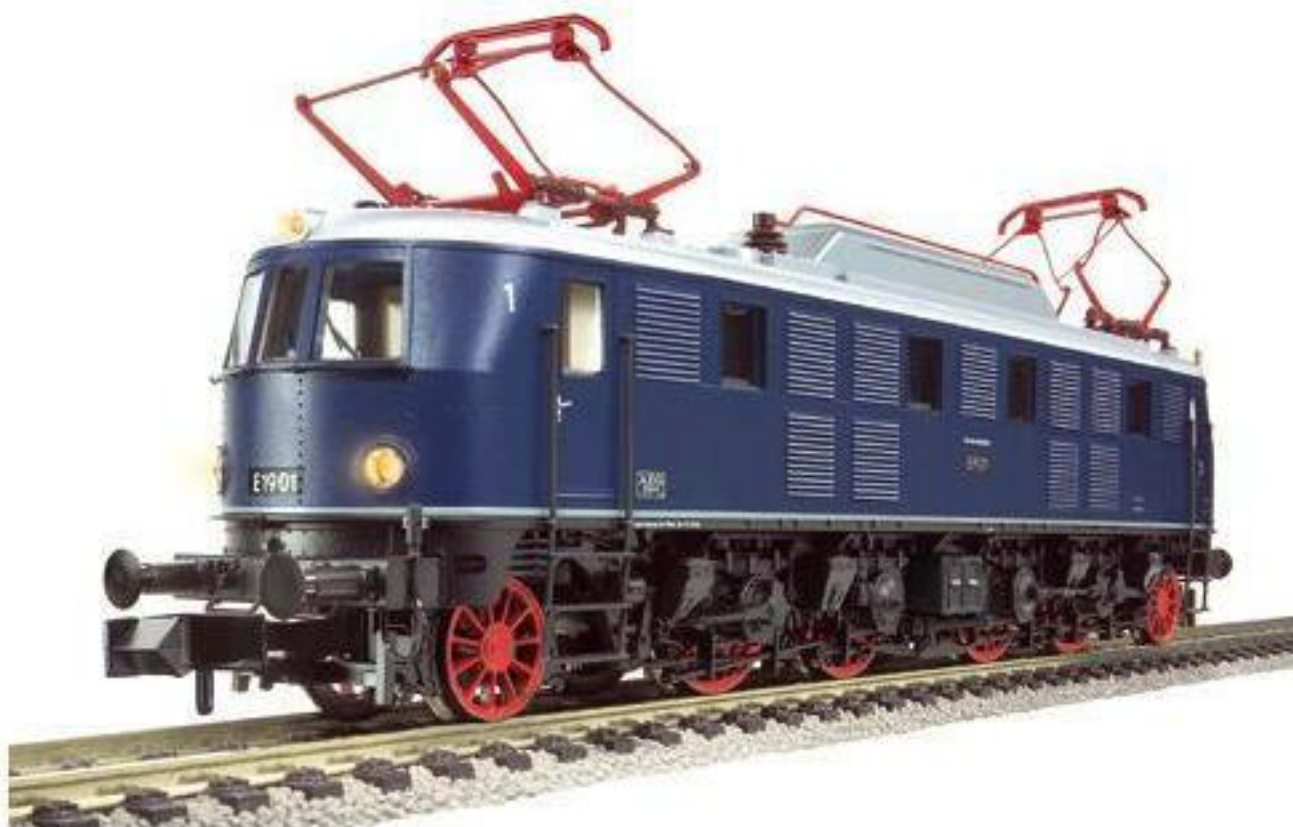
7319 · Elektrische Lokomotive der DB, Baureihe E 19.0, LüP: 106 mm.