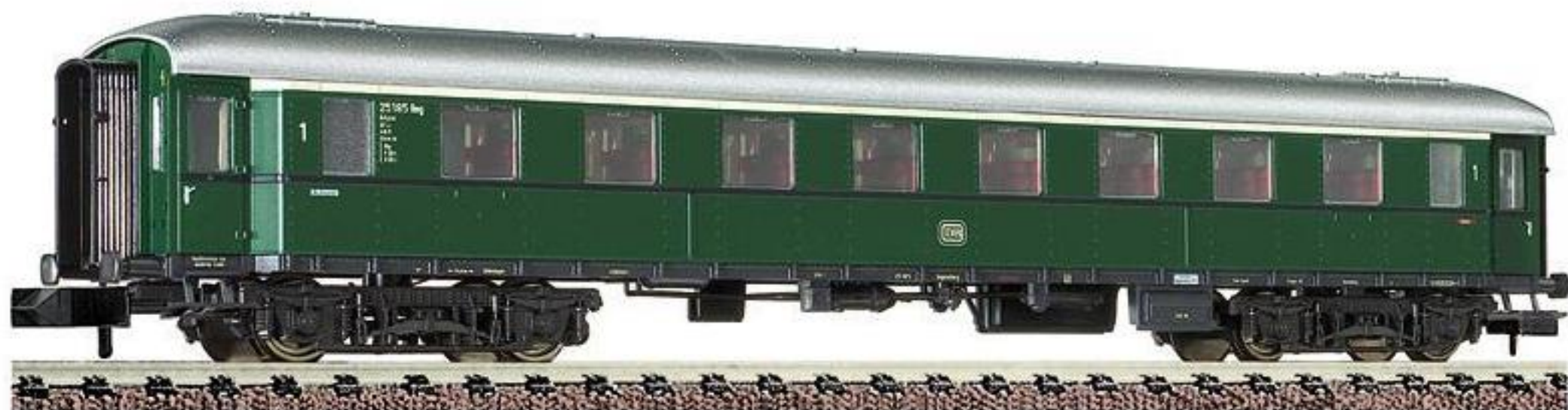
8675 · Eilzugwagen 1. Klasse, Bauart A4ys-30/55 der DB, LüP: 136 mm.