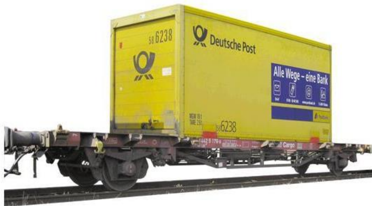
8242 · Container-Tragwagen, Bauart Lgs 579 der DB AG, LüP: 85 mm.