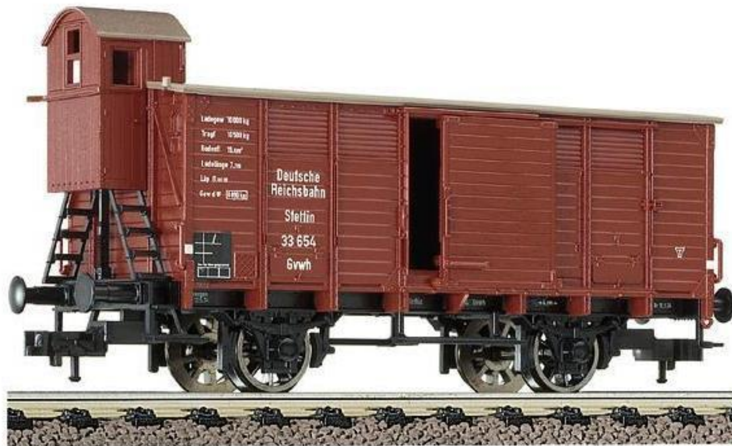
5360 · Gedeckter Güterwagen mit Bremserhaus, Bauart Gvwh Stettin der DRG, LüP: 101 mm.