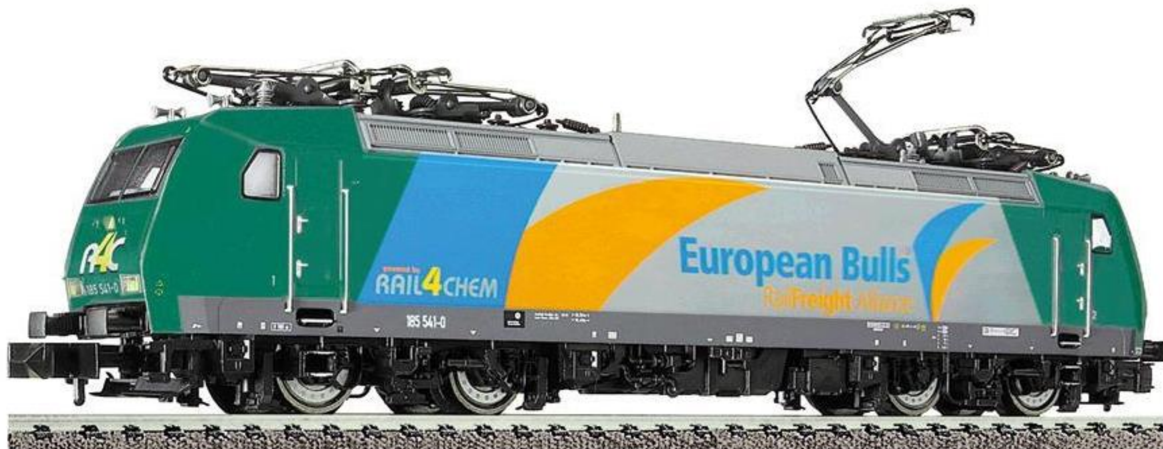
86 7385 · Elektrische Lokomotive der RAIL4CHEM/European Bulls, Baureihe 185, LüP: 118 mm.