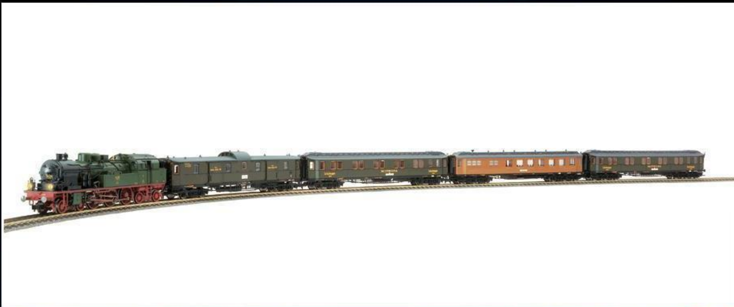
7913 · Geschenkpackung 90 Jahre MITROPA der P. St. E. V.