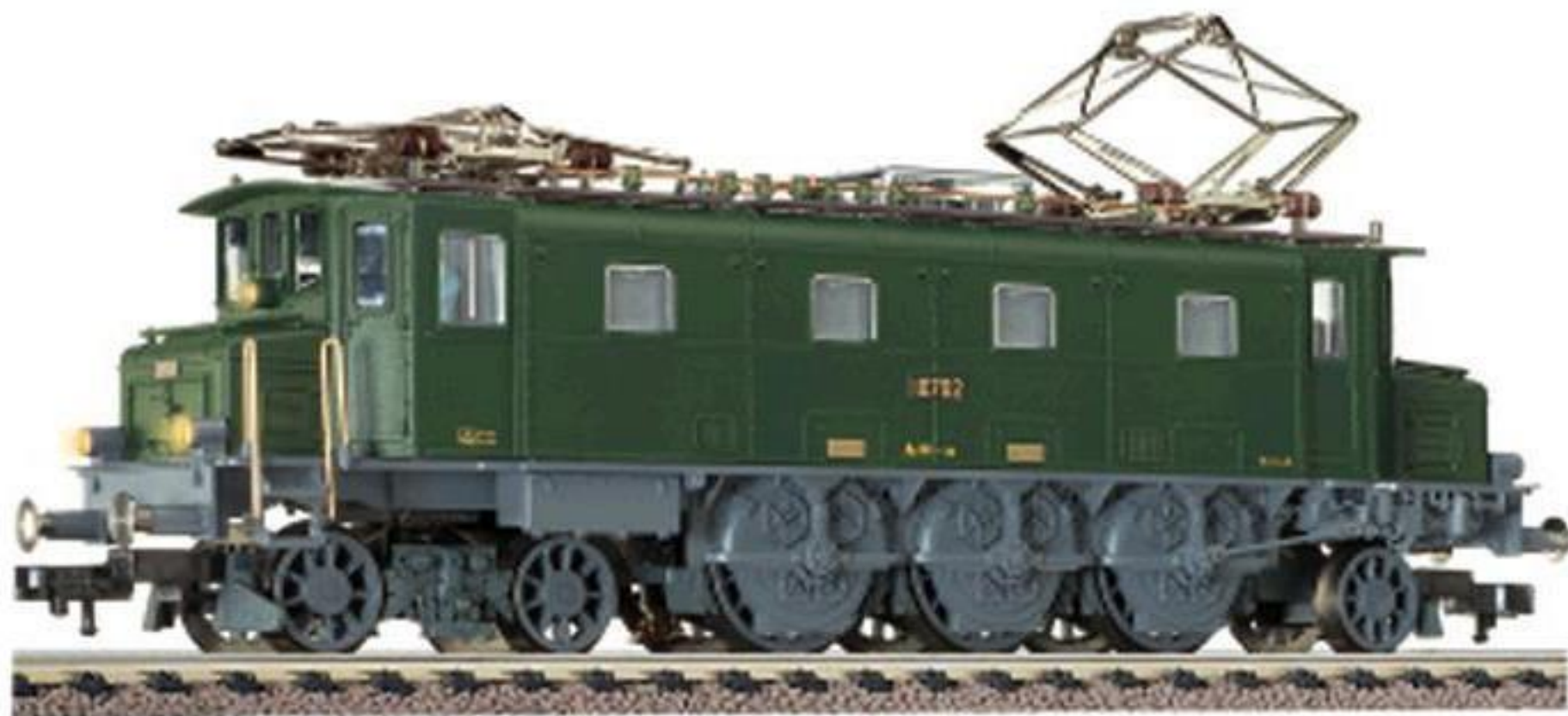
4337 · Elektrische Lokomotive der SBB, Reihe Ae 3/6, LüP: 169 mm.