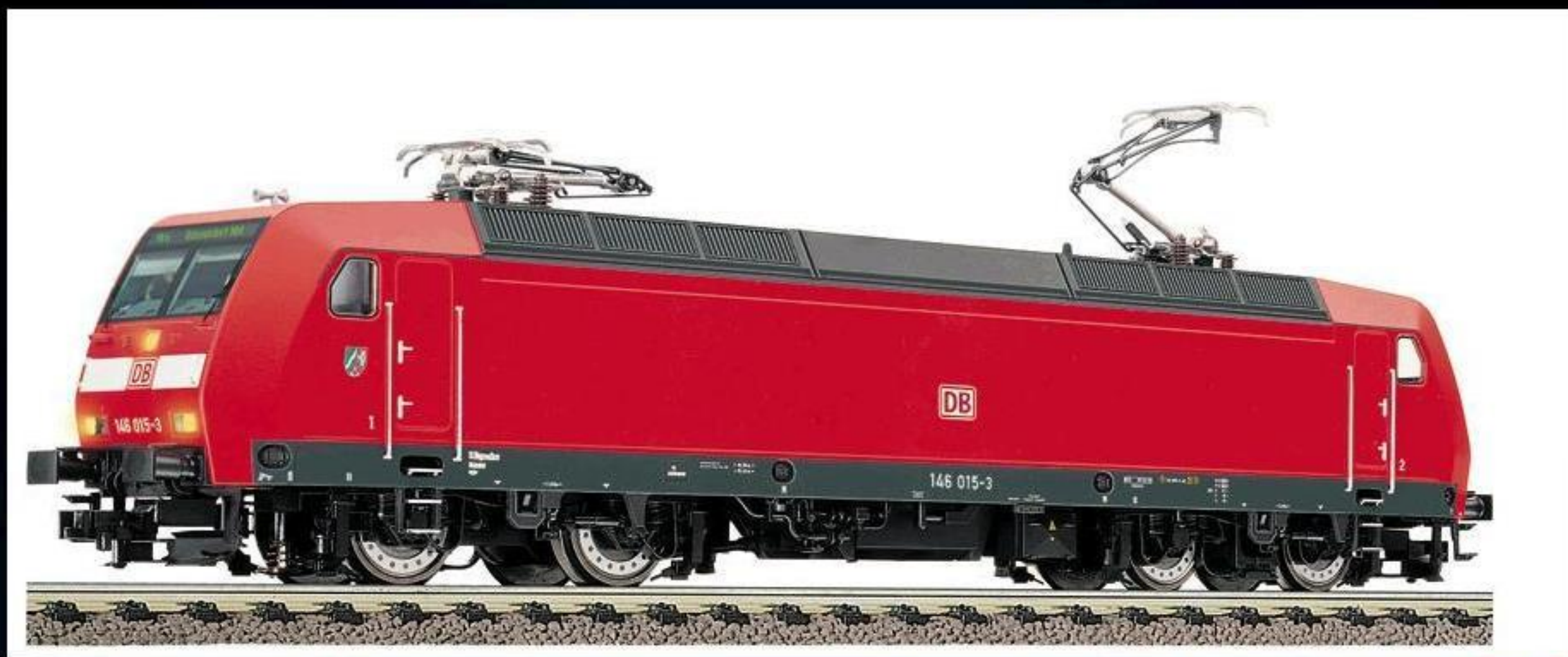
4324 · Elektrische Lokomotive der DB AG (DB-Regio), Baureihe 146, LüP: 217 mm.