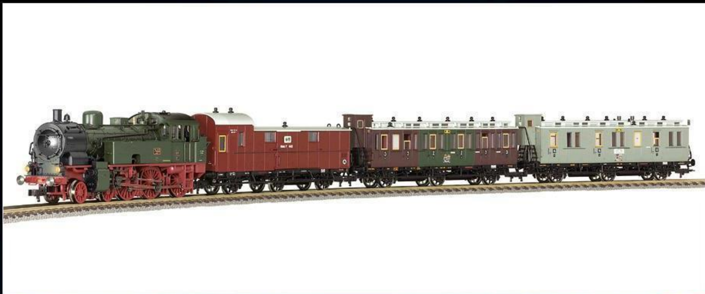
4903 · Geschenkpackung Personenzug der K.P. u. G.H. St.E.