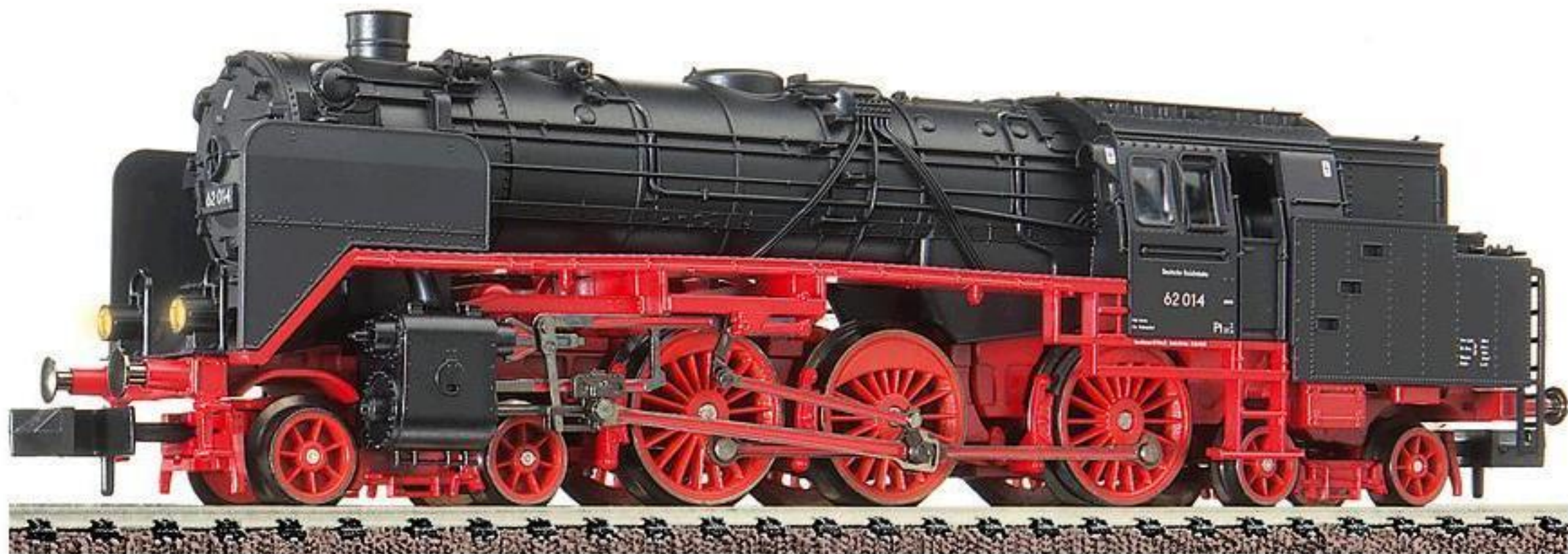
7054 · Tenderlok der DR, Baureihe 62, LüP: 107 mm.