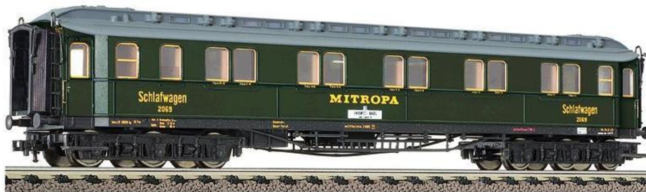
86 5874 · 6-achsiger Schnellzug-Schlafwagen, Bauart WL 6ü der MITROPA, LüP: 236 mm.