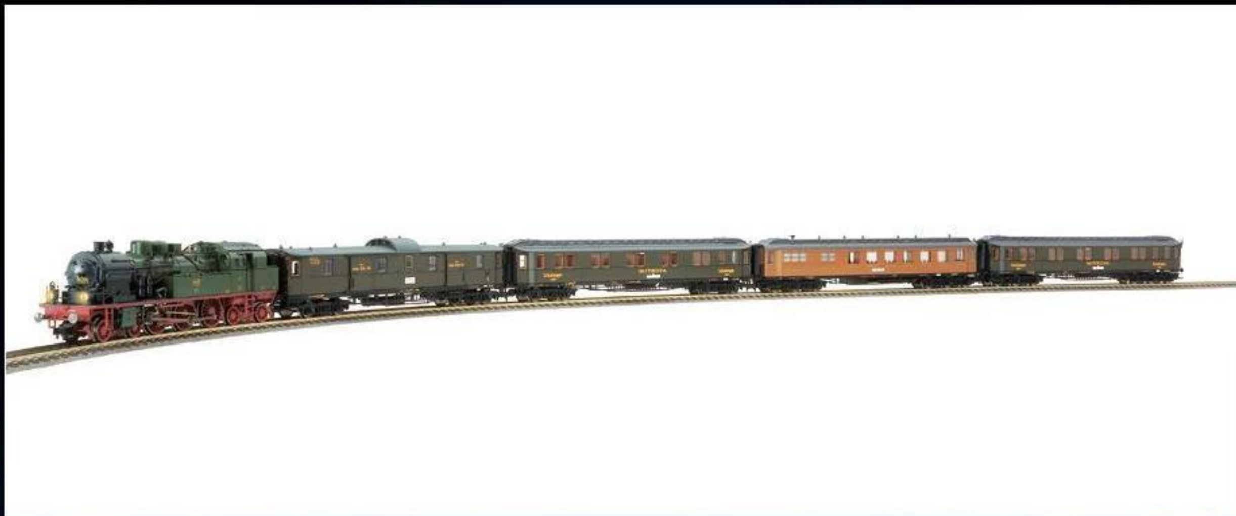
4913 · Geschenckpackung 90 Jahre MITROPA der P. St. E. V.