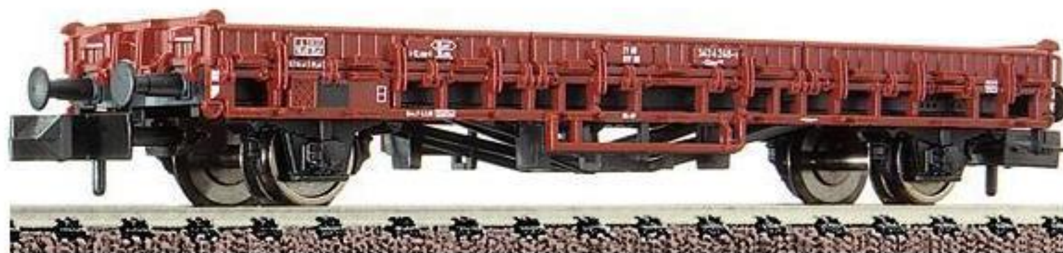
8258 · Güterwagen, Bauart Klms 440 der DB, LüP: 75 mm.