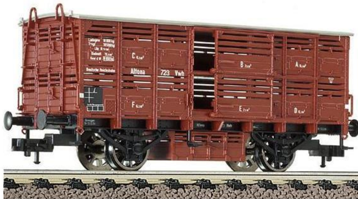
5355 · Kleinviehswagen, Bauart Vh Altona der DRG, LüP: 98 mm.