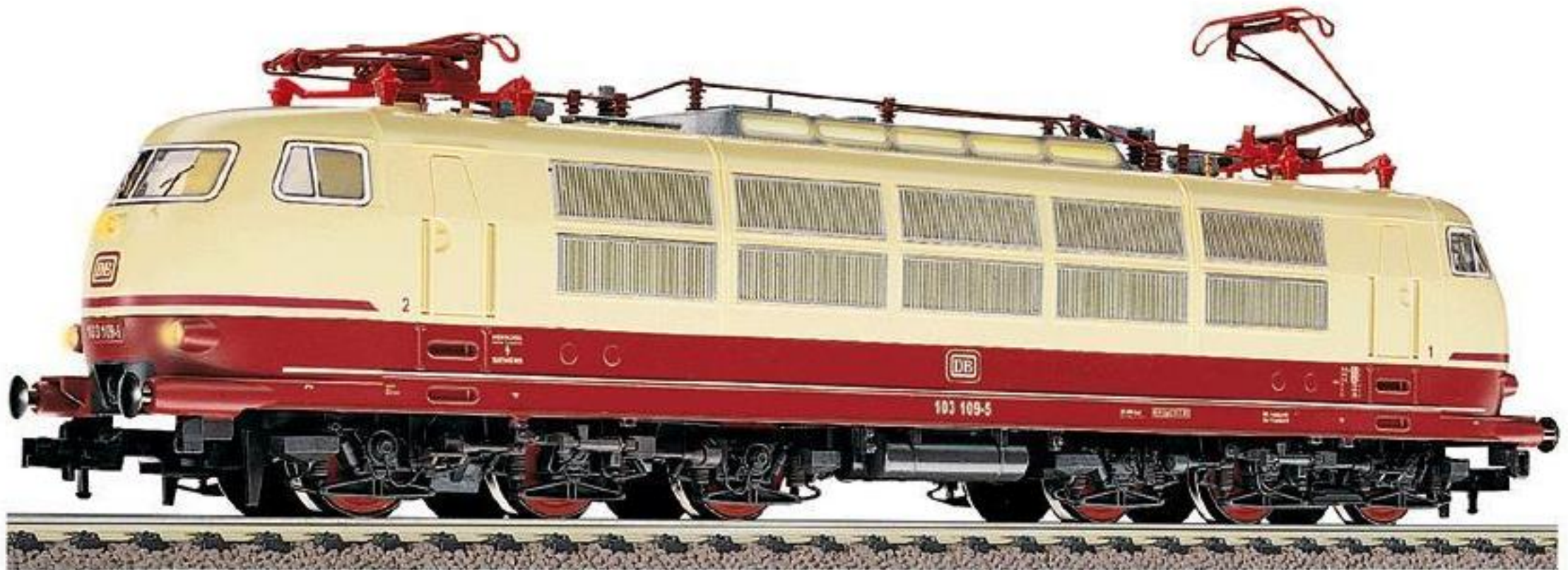
7 4376 · Elektr. Lokomotive der DB, Baureihe 103.1, mit DCC-Sound-Decoder, LüP: 223 mm.