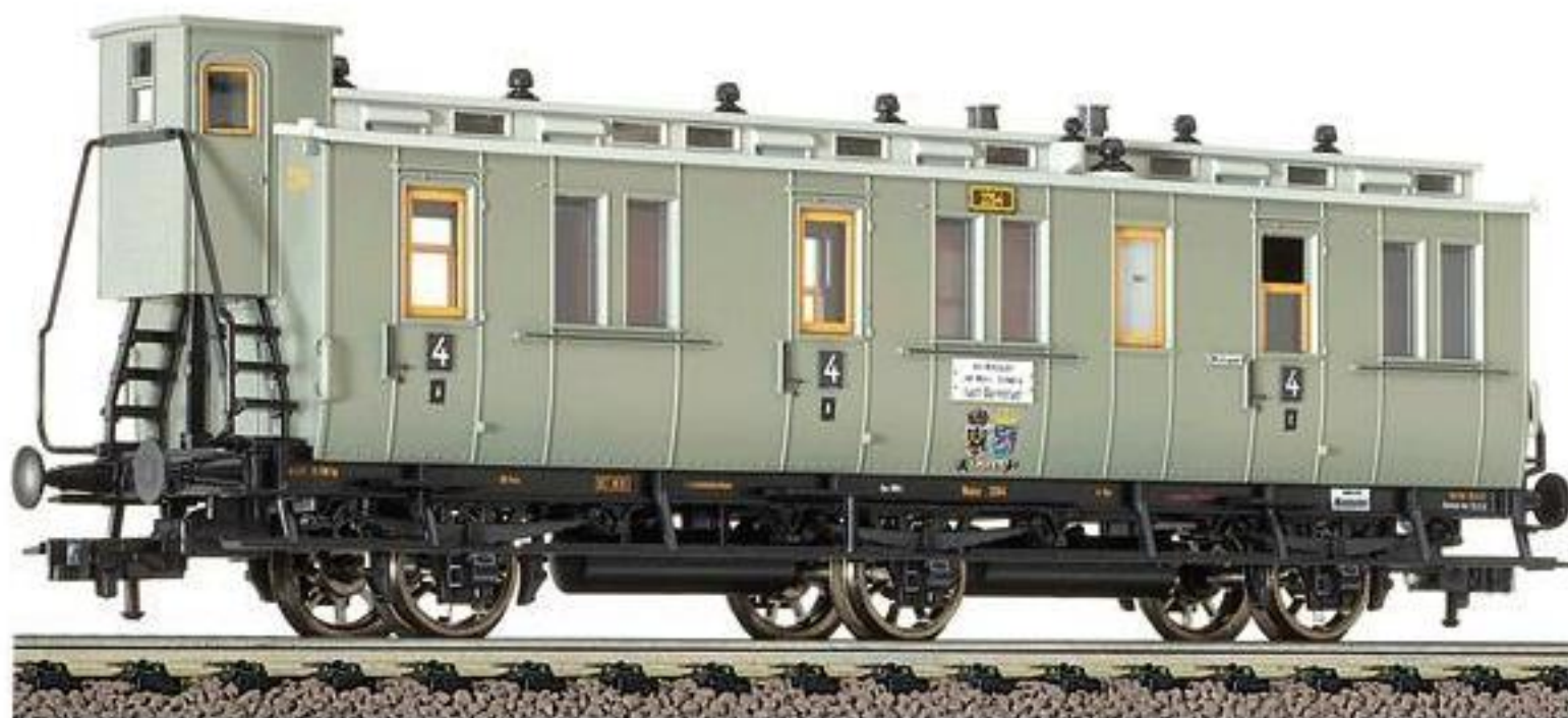
86 5833 · 3-achsiger Abteilwagen 4. Klasse, Bauart D 3 tr pr 02 der K.P. u. G.H. St.E., LüP: 140 mm.