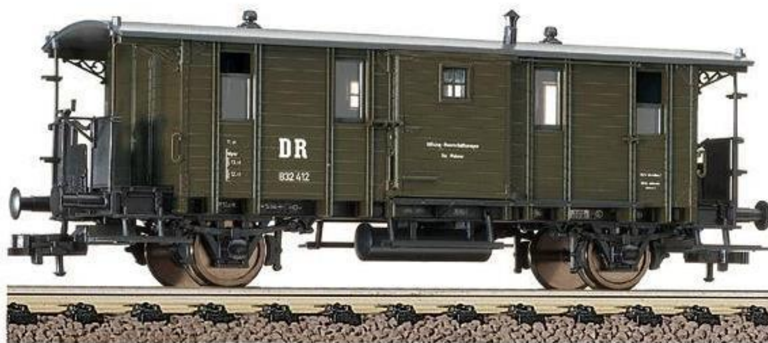
5756 · Bahndienstwagen mit Endplattformen der DR, LüP: 115 mm.